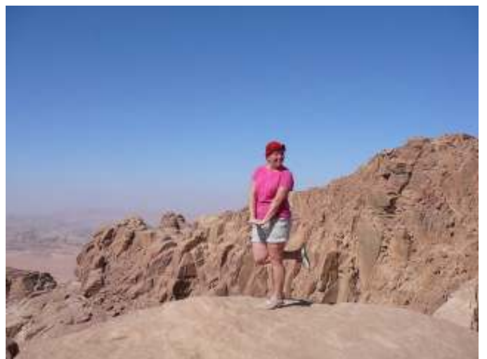
Daar word ik blij van

Aan de dunne van onder en ook van boven vloog er van alles uit dat gewoon binnen had moeten blijven: zo ziek als een hond en die kan tenminste nog lopen. Pfff. Lopen lukte niet meer zonder hulp, praten nauwelijks en dorst als een paard. 40+graden is iets teveel voor onze lijfjes en de hele groep werd een voor een geveld. Maar wat een saamhorigheid. Heel bijzonder als je elkaar nog maar anderhalve week kent. Daar word ik blij van. Ieder deed wat hij wilde doen en toch waren we samen.