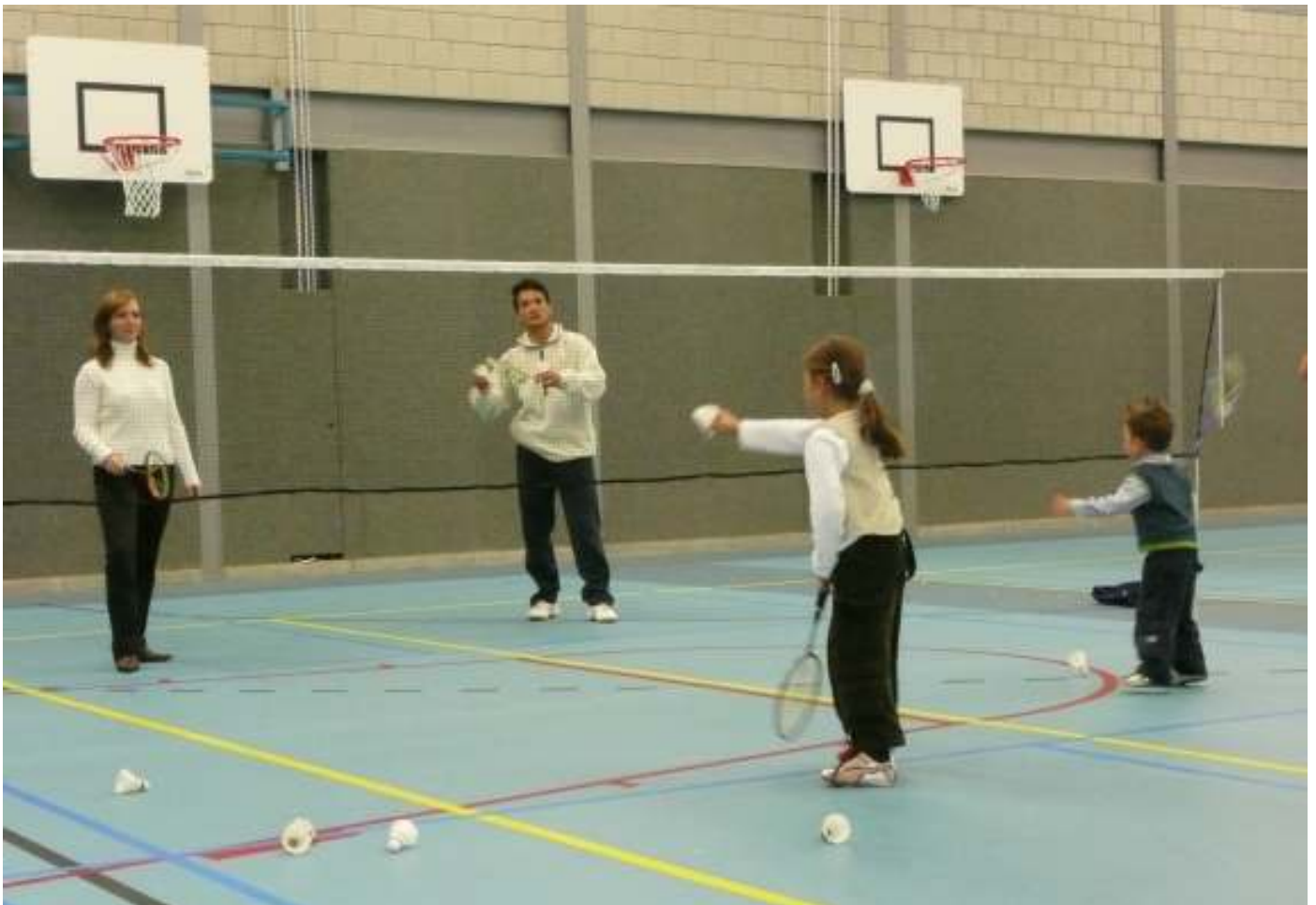
Jong geleerd is oud gedaan...